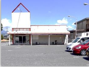
訓練実施施設 外観