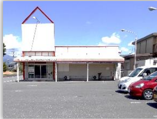
訓練実施施設 外観