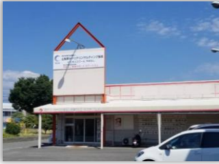
訓練実施施設 外観