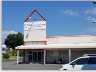
訓練実施施設 外観