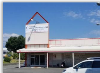
訓練実施施設 外観